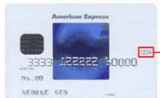
4 Digit Card Verification Number

Ako na domaćoj American Express kartici (počinje sa 3775) postoji troznamenkasti kontrolni broj, potrebno je njega upisati, u suprotnom se upisuje četveroznamenkasti. Za ostale American Express kartice treba upisati četveroznamenkasti kod.